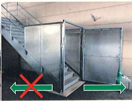
非常階段の出入口(1階)