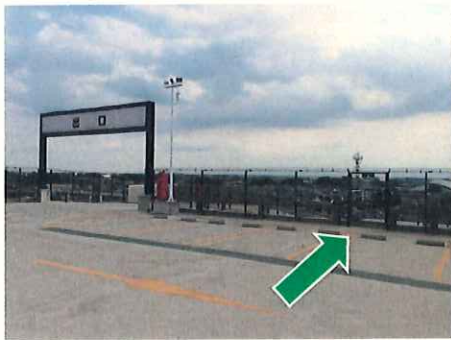
非常階段の徒歩出口(屋上)